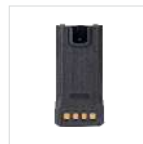
Batería de polímero de litio 2000mAh