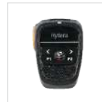
BT Micrófono altavoz inalámbrico a distancia