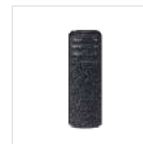
Clip para cinturón