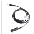
Cable de programación (USB)