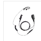
Auricular con cable