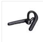
Auricular inalámbrico BT