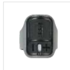
PTT de anillo inalámbrico BT