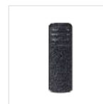
Clip para cinturón