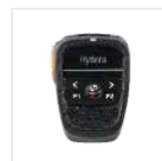
BT Micrófono altavoz inalámbrico a distancia