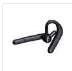
Auricular inalámbrico BT