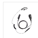
Auricular con cable